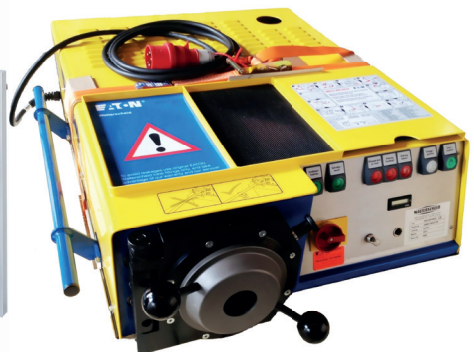
GS Hydro Walform maskine Kan bruges til syrefast rør i størrelsen 10-42 mm S og L serie. Opfylder DIN 2353 ISO 8434-1.